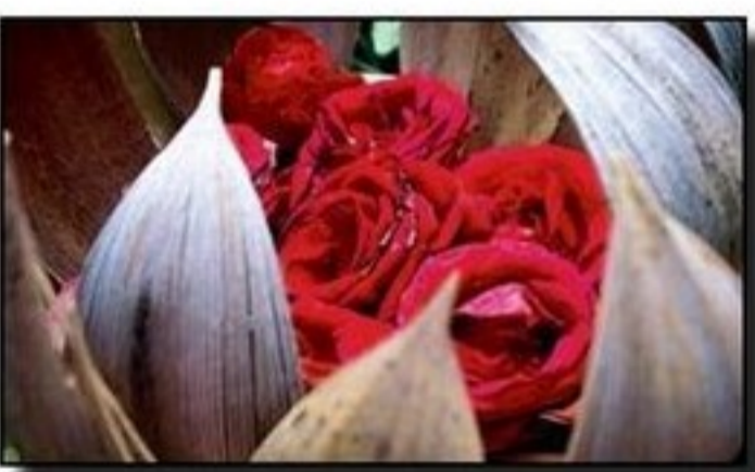
ROSOR. Ett arrangemang med röda rosor.