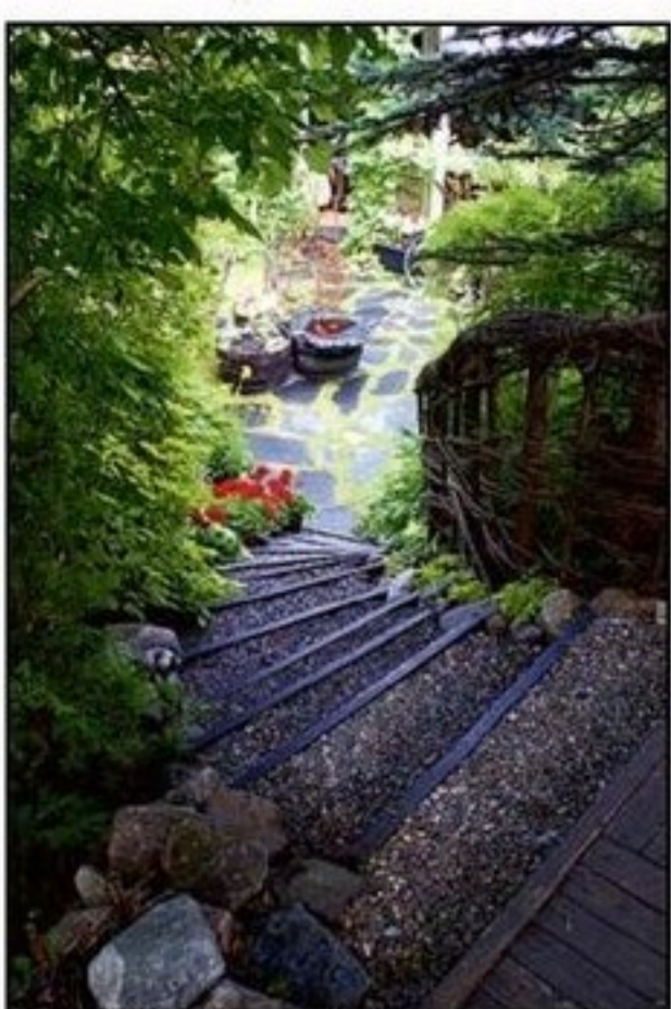
FLERA VÄNINGAR. En trappa leder besökaren till de övriga etagererna i Pilgården.