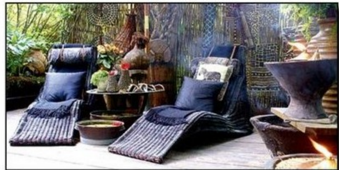
TEMA. Afrikanskt tema är en av stilarna i trädgården. Här kan du också se exempel på vad mycket man kan göra med eld och vatten.