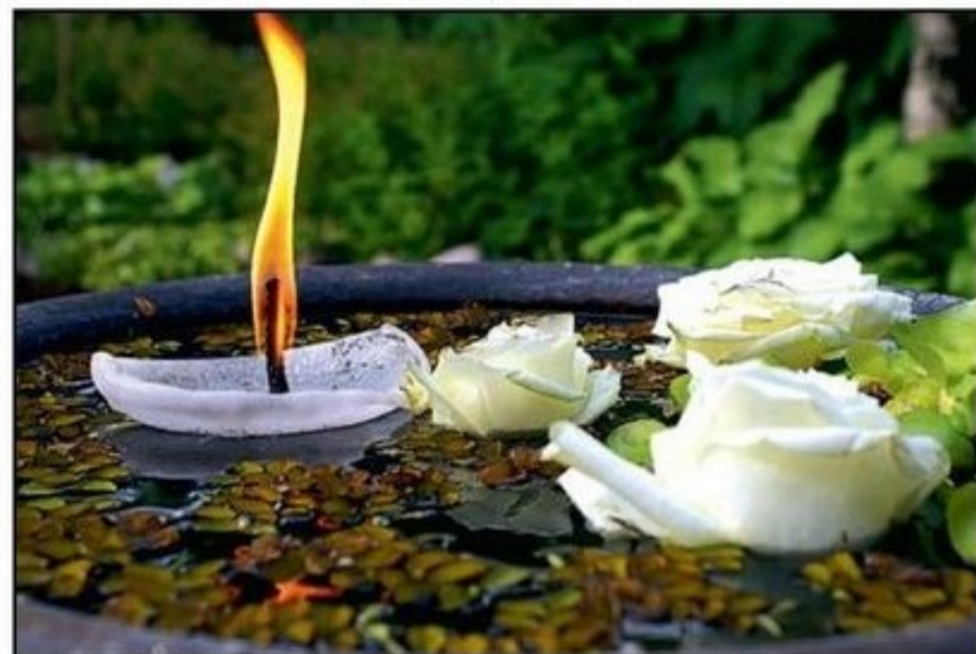
UTSMYCKNINGAR. Små dekorationer kan man finna lite varstans i trädgården.