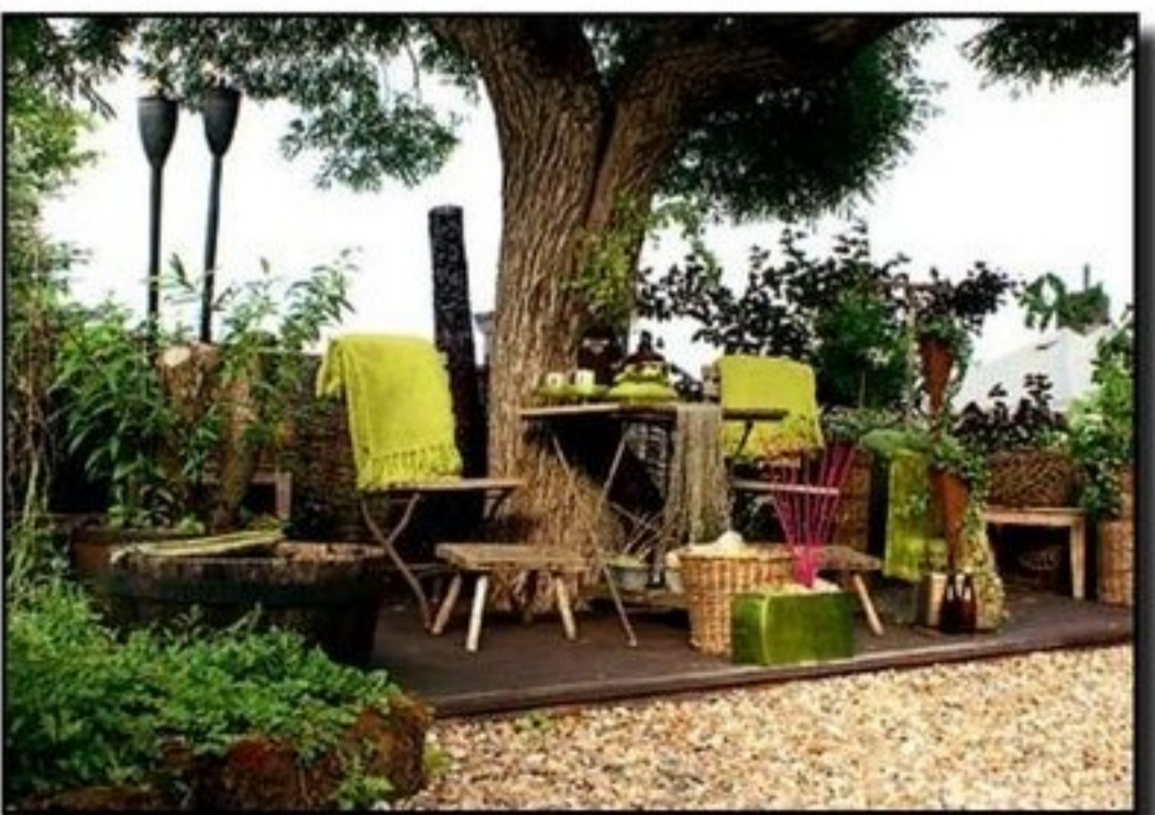
FIKAPÅS. Trädgården har olika avdelningar. Här passar en kaffe för två under pilen.