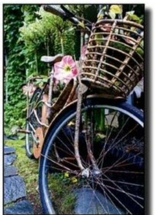
ÅKDON. En cykel kan också vara en prydnad