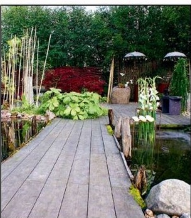
MYCKET VATTEN. Bro över en damm där bambu, stenar och mycket grönt ramar in. I ena hörnet porlar en liten fontän.